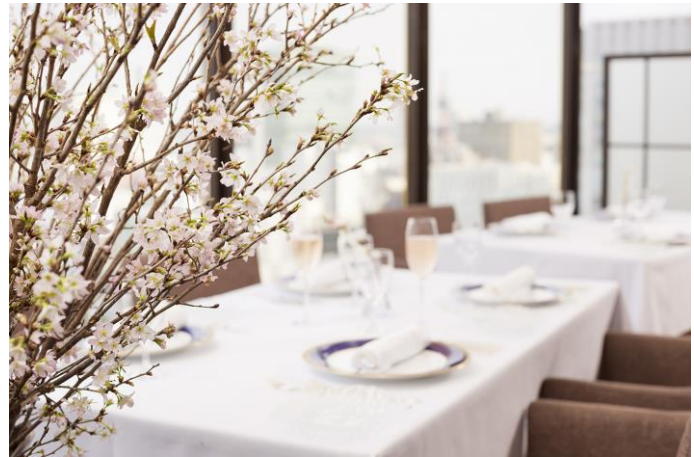
スカイレストラン「ロンド」の店内図