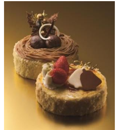
ツインケーキ [モンブランケーキ+バイクドチーズケーキ]