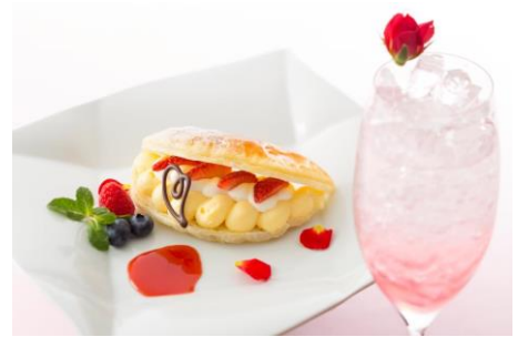
▲「母の日」特製デザートとローズドリンク