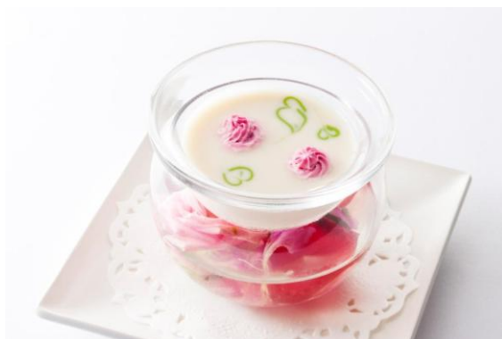
本日の冷たいスープ