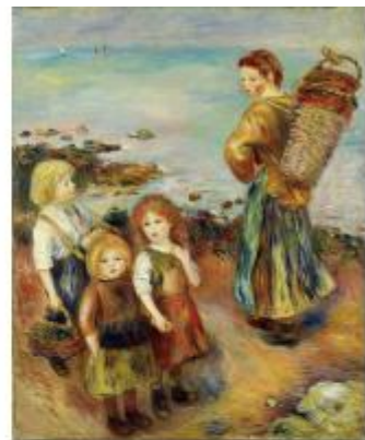
▲ピエール・オーギュスト・ルノワール 《ムール貝探し》 1888-1889年頃 ポーラ美術館蔵

【主催】北海道立近代美術館、北海道新聞社、北海道放送、公益財団法人ポーラ美術振興財団 ポーラ美術館