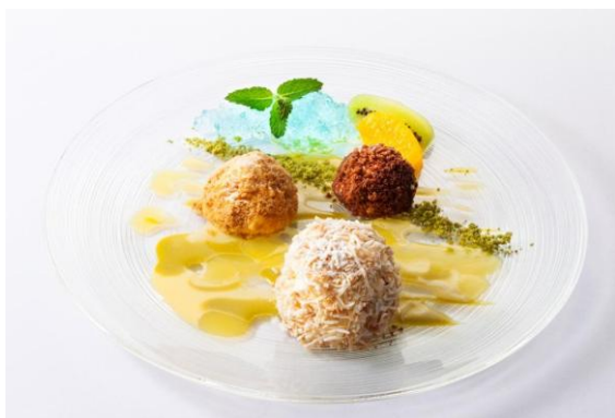
三種のムース ジヴェルニーの積みわら風 フルーツ添え