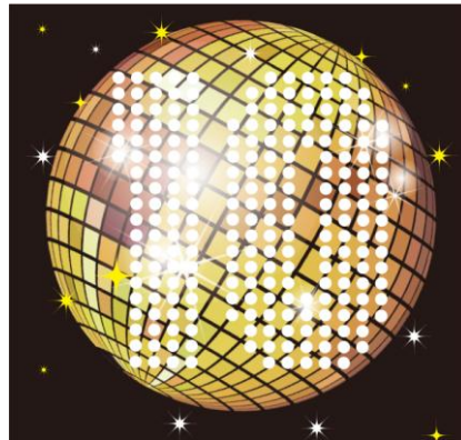
今年で10回目を迎えるディスコイベント「ワンナイトフィーバー」

参加者のリクエスト曲をメールで事前募集！ 札幌のディスコ史を振り返るパネル展も同時開催!! 2014年11月19日(水)