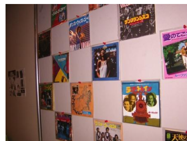
レコードジャケット展示（イメージ）